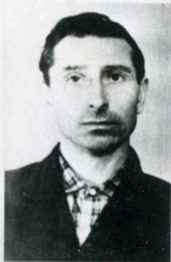
Маховик С.М. 1931 г. осужден к 3,5 обще- го режима.